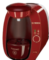
TAS 2005EE Czerwony