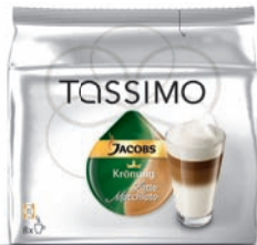
Jacobs Krönung LATTE MACCHIATO