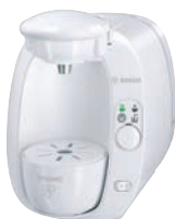
TAS 2001EE Biały