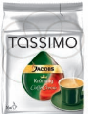
Jacobs Krönung CAFÉ CREMA

Intensywne, aromatyczne espresso zwieńczone aksamitną kawową pianką. Wyjątkowa kompozycja średnio palonej kawy z nutką kwaskowatości charakterystyczną dla szlachetnych ziaren kawy Arabica. Idealna, gdy potrzebujesz zastrzyku energii w zabieganym dniu.