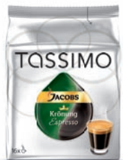
Jacobs Krönung ESPRESSO

Trójwarstwowa kompozycja intensywnego espresso, mleka i puszystej mlecznej pianki. Jej elegancki wygląd, delikatny smak i aromat to zapowiedź prawdziwej uczyty dla wszystkich zmysłów. Kawa idealna na chwilę relaksu lub zaproszenie do długiej rozmowy.